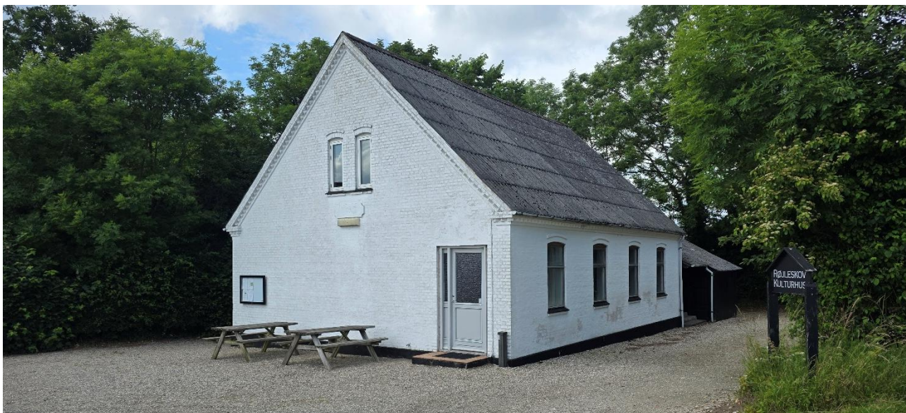
1. Røjleskov Kulturhus, 2025 (Marc Melgaard)